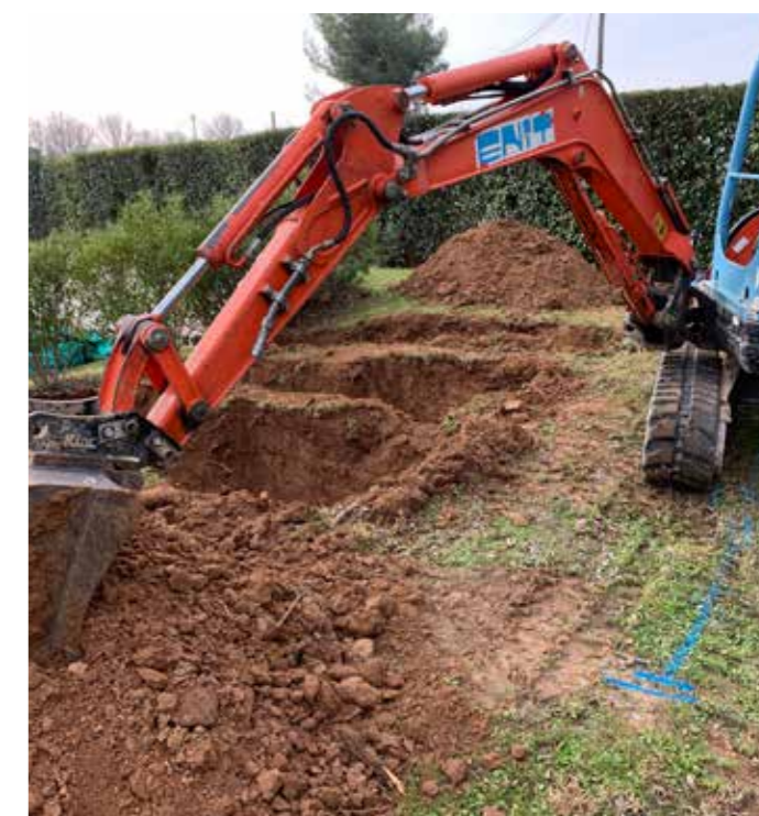
7 Terrassement à la mini pelle