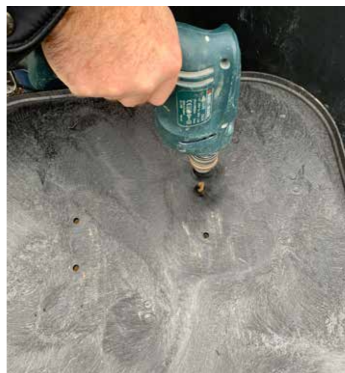
3 Percement du fond pour la fixation des Rails Support Compteur