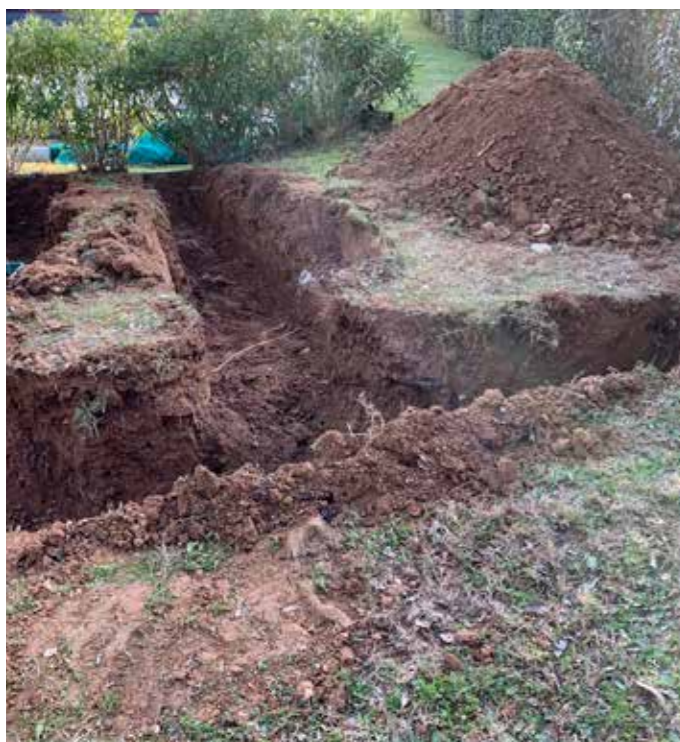
8 Terrassement 2 à la mini pelle