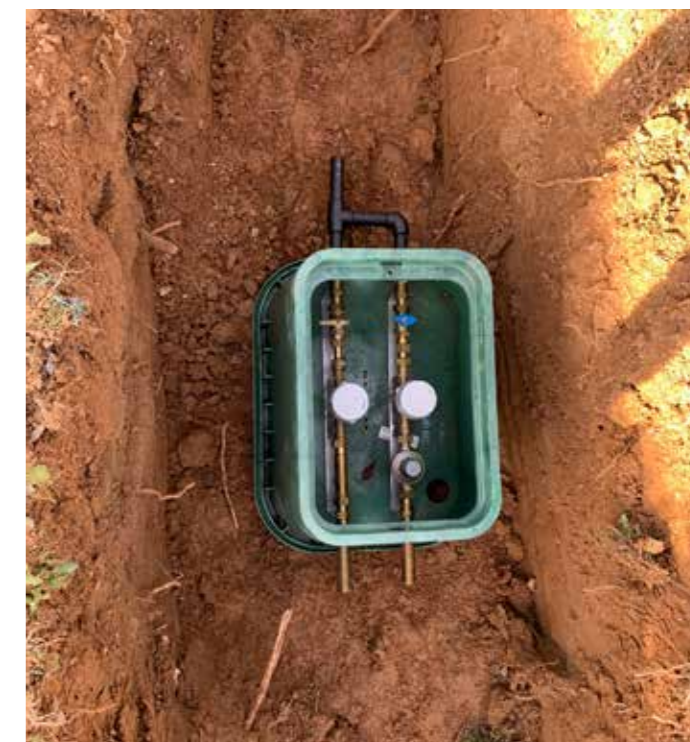
5 Montage de l'hydraulique dans le regard