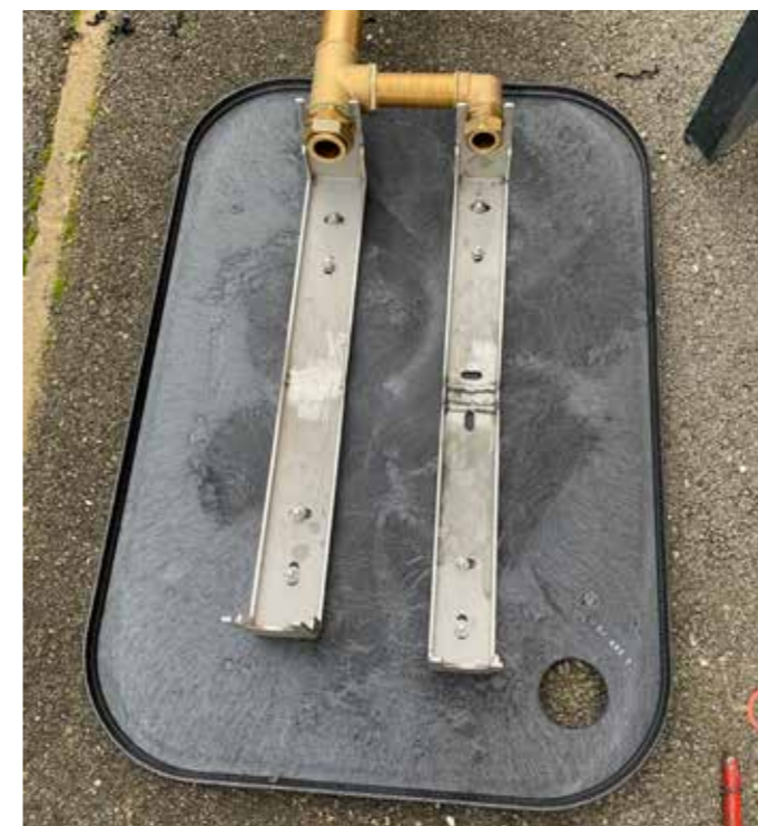
4 Fixation des rails support compteur (écrou en haut, vis sous le regard)