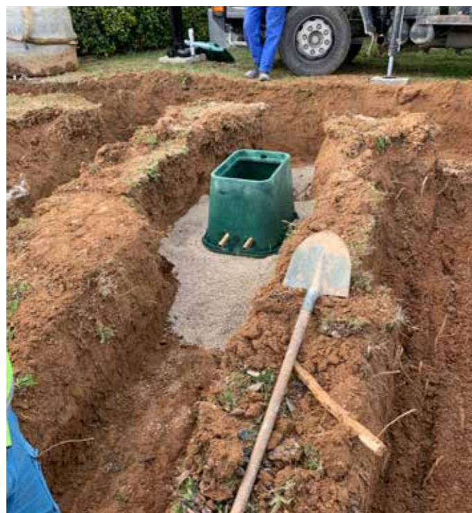
9 Mise en place d'un lit de grain de riz sous le regard pour le mettre de niveau