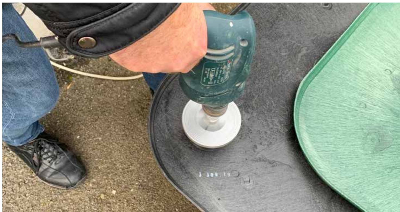
1 Percement du fond du regard pour l'évacuation des eaux