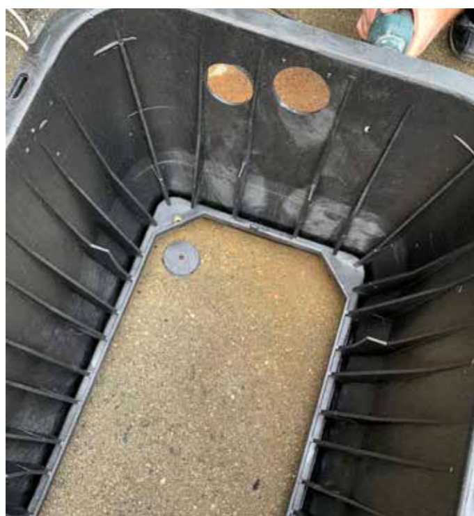
2 Percement des parois du regard pour les entrées et sorties hydrauliques