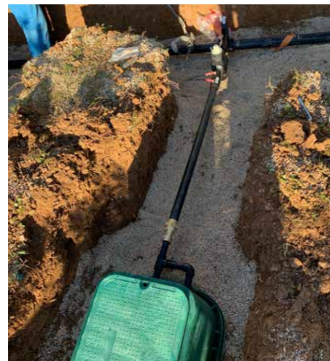
12 Raccordement 2 Hydraulique du regard