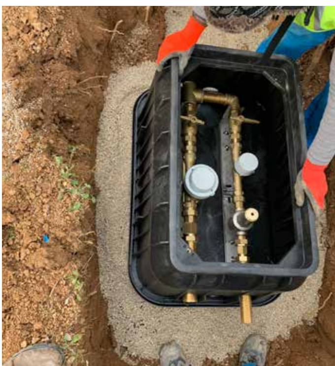
10 Mise à niveau du regard