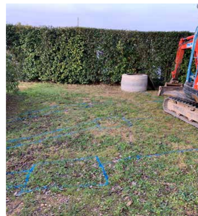
6 Implantation des regards sur le réseau.