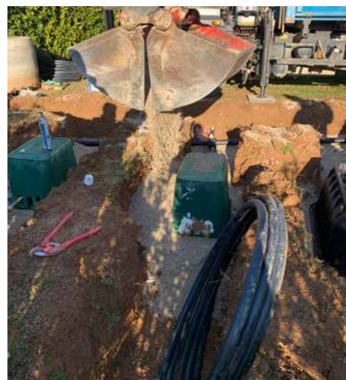
14 Remblaiement progressif en grain de riz autour du regard