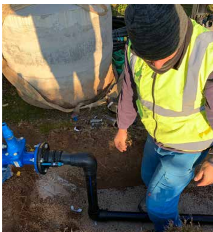
11 Raccordement Hydraulique du regard